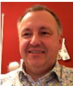
Harry Schitthof den SEB und