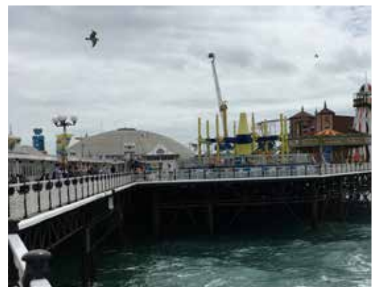
Am Pier in Brighton

In Brighton angekommen liefen wir durch die engen Gassen, die mit den verschiedensten kleinen Geschäften geschmückt waren. Obwohl das Wet-