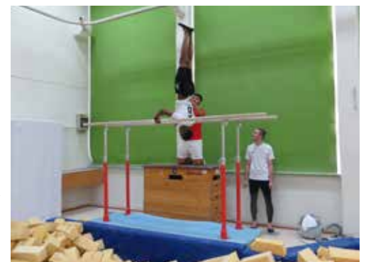
Die Jungen beim Barrenturnen