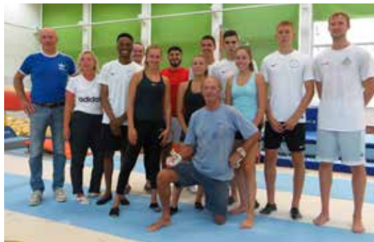
Der 13er-Sport-Leistungskurs mit dem vielfachen deutschen Meister und Olympiateilnehmer 1972 in München Bernd Effing (vorne kniend)

Artikel 5: Angemessene Einrichtungen und Ausstattung sind unerlässlich für Leibeserziehung und Sport.