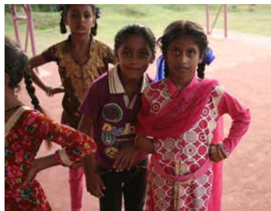
Kinder in Cowdalli

Aber wir wollen natürlich nicht alle Inder in einen Topf werfen, eher können wir feststellen, dass fast alle Inder, die wir trafen, äußerst freundliche, aufgeschlossene, unverstellte und vor allem neugierige Menschen waren. Und mindestens genauso, wie uns die ein oder andere Aktion und Verhaltensweise der Inder als seltsam oder skurril vorkam, irritierten wir sie wohl mit unseren Gepflogenheiten. Wenn eine Gruppe von weißen Jugendlichen mit riesigen Rucksäcken durch eine überfüllte indische Straße läuft, sich bei jedem Hupen die Ohren zuhält, bei den Motorrädern zurückschreckt und um ihr Leben bangend durch die Gegend hüpfet oder auch mal stehen bleibt, um sich gegenseitig den sich schon pellenden Nacken einzucremen, dann kann man sich vorstellen, wie bizarr das auf einen vorbeikommenden Inder wirken muss.