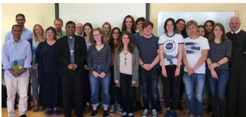
Gesprächsteilnehmer in der Lela

Im nächsten Jahr, kündigte uns der Bischof an, werde er gerne noch einmal kommen. Aber obschon auch wir dieses Mal unsere Fähigkeit zur spontanen Aktion unter Beweis stellen konnten, so wären wir, ehrlich gesagt, für eine nicht ganz so kurze Vorlaufzeit dankbar.