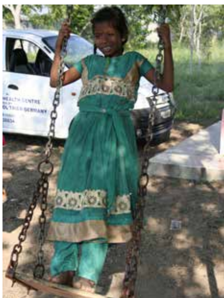
Besuch der Geburtshilfestation

Aber auch wenn es nicht ganz dem Sinn einer solchen Reise entspricht, reibungslos zu verlaufen, hätte wohl niemand damit gerechnet, dass wir gleich zu Beginn zwei unserer Mitglieder am Flughafen in Paris würden zurücklassen müssen (sie kamen einen Tag später trotzdem in Indien an). Das war nur der Anfang von so vielen, oft auch skurrilen Ereignissen, die uns durch die vier Wochen begleitet haben. Denn sobald man glaubte, man hätte dieses riesige Land auch