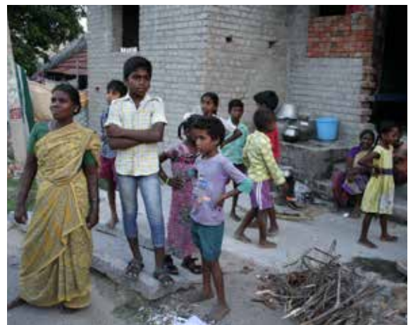
Unterwegs bei der PMD

Der Erkenntnisgewinn der Reise ist also ein individuellerer und deshalb einer, für den unsere Reisegruppe sechzehn Artikel schreiben müsste. Auch dann ist zu befürchten, dass man erneut bei allgemein verbreiteten Tatsachen landet, weshalb wohl der einzige Schluss einer theoretischen Beschäftigung mit Indien in der Aufforderung zur Praxis liegen kann. An die Stelle des Fazits, dort also, wo diese Beschreibung darin scheitert, die gesamte Erfahrung einer Indienreise auf den Punkt zu bringen, tritt die Ermutigung, ein eben solches Unterfangen selbst zu