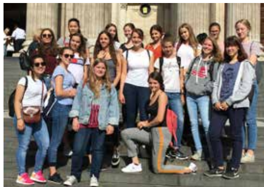
Vor dem Eingang der St. Paul's Cathedral

Wahrscheinlich, weil ich eine U-Bahnfahrt noch nie wirklich selbst erlebt hatte und es mehr als eine Art Attraktion Londons sah. Den Fehler hätte ich nicht begehen dürfen: U-Bahnfahren in London ist alles andere als schön. Es ist heiß, stickig und man wird mit viel zu vielen anderen fremden Men-