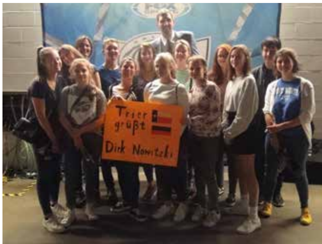
Die Gruppe mit Dirk Nowitzki

die interessant aufgebaute Ausstellung gut in die damalige Situation hineinversetzen konnte. Danach haben wir noch zusammen in einem typisch amerikanischen Diner zu Mittagessen gegessen. Bisher war das texanische Essen vielleicht nicht das Gesundeste, aber dafür schon ziemlich lecker. Mich überraschte, dass die mexikanische Kultur recht hohen Einfluss auf Texas hat, was die vielen beliebten mexikani-